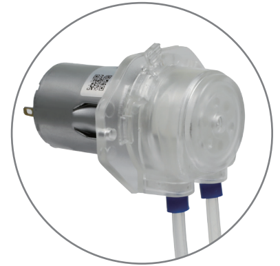
直流有刷、无刷电机