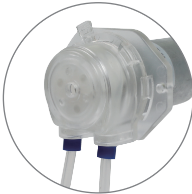
卡管方式: 管套/外置管接头